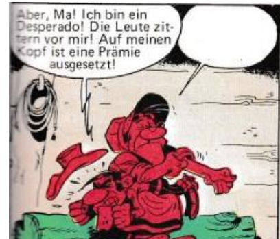
"s" + Zweites Wort

Gehe zum so ermittelten Startpunkt. Es ist kein Schild vor Ort, man muss den Punkt in der Wanderkarte suchen. Hier steht ein schöner Grenzstein. Von hier folge dem „Lucky-Luke-Weg“, der hinter einer Kiefer beginnt, die sich in